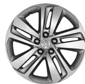
17" алуминиумска наплата PHOENIX (1)