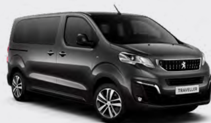
Сива Platinum (2)