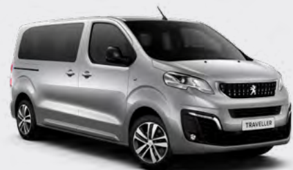
Сива Artense (2)