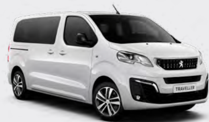
Бела Vanquise (1)