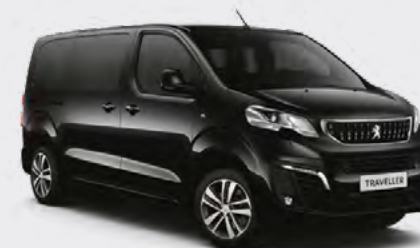
Црна Perla Nera (1)