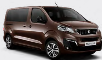
Кафеава Rick Oak (2)